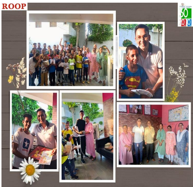
Visit to Udayan Care Boys Home, Narsinghpur Gurugram.