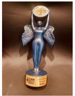
"BEST CSR IMPACT MAKER OF THE YEAR" award for Women Empowerment at 7th CSR Health Impact Awards 2023