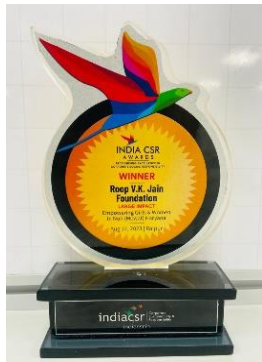
"Large Impact Award for Empowering Girls & Women" at the India CSR Awards 2023