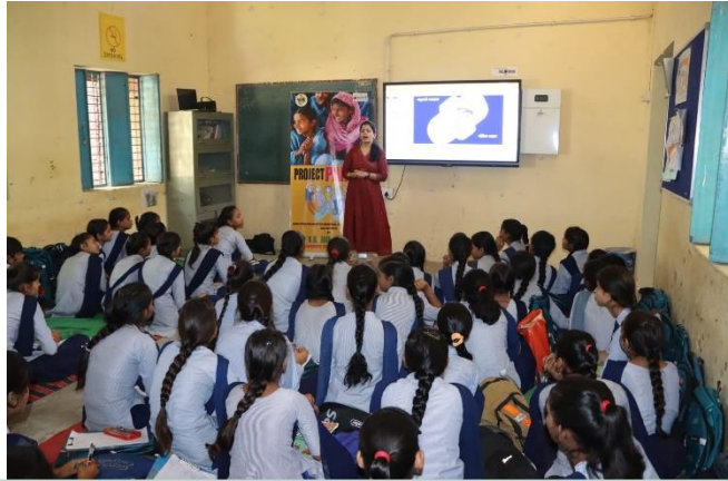
Multiple training programs were organized at Government Schools in Manesar, Bhangrola, and in villages and Panchayats focusing on "Menstrual Hygiene Management." We also have distributed hygiene kits through our project, Pankh.