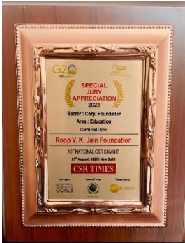
Award for Education initiatives at 10 th CSR Summit 2023 by CSR Times