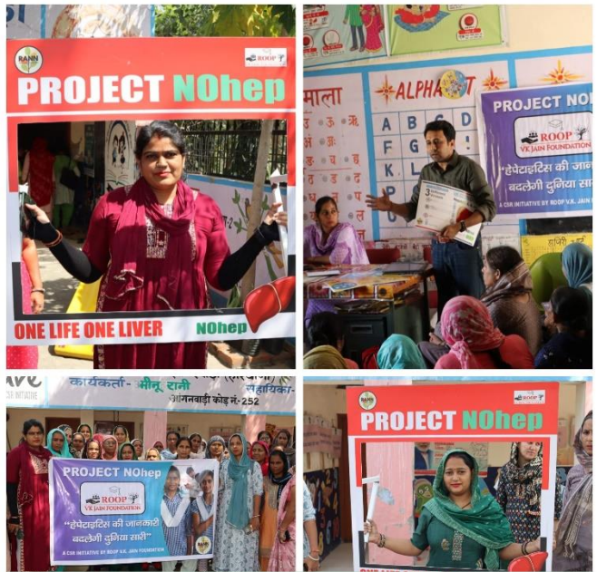
Awareness and prevention program on Hepatitis B & C at nearby villages of Dharuhera